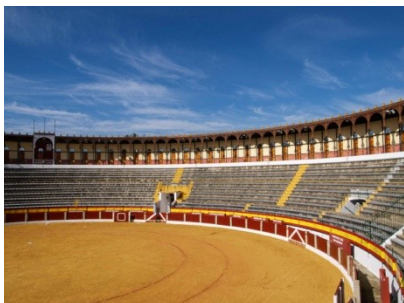
Plaza de Toros de Almendralejo

Después del almuerzo, la tarde será libre para que los participantes exploren la zona a su propio ritmo o simplemente descansen y se relajen. El Ayto. de Almendralejo, por cortesía, ofrece al Club una visita guiada por diversos sitios de la localidad.