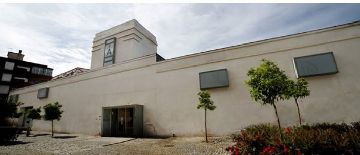
Museo de las Ciencias del Vino

A las 21:30 de la noche, nos reuniremos nuevamente para una cena especial, durante la cual se llevará a cabo la entrega de premios y regalos para celebrar esta increíble aventura en moto.