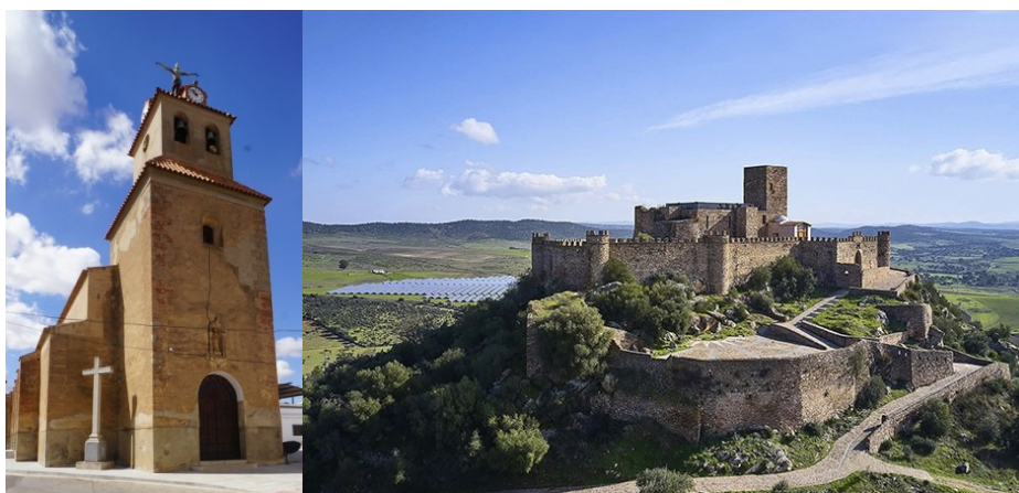
Solana de los Barros

09:00h. El sábado, la ruta dará comienzo a las 9 de la mañana, con todos los depósitos de las motos llenos y listos para recorrer los impresionantes paisajes que nos esperan. El recorrido pasará por lugares emblemáticos como Solana de los Barros, conocido por sus tradiciones culturales arraigadas y su música folclórica. La Albufera, un hermoso paraje natural con una gran diversidad de aves acuáticas y flora autóctona gracias a sus lagunas y estanques temporales, y una visita al impresionante Castillo de Miraflores. Una imponente fortaleza de origen islámico, que se remonta al Emirato o al Califato Omeya de Córdoba, como lo atestiguan las cerámicas islámicas de los siglos IX y X encontradas en el lugar y que ha sido testigo de importantes eventos históricos a lo largo de los siglos.