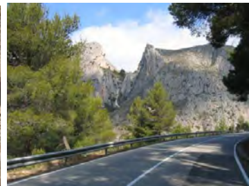
Ctra. Del Coll de Rates

Continuaremos por la revirada carretera pasando por Parcent, Orba, Tormos y Sagra hasta llegar a Pego, donde tomaremos la CV-768 que atravesando El Parque Natural del Marjal de Pego-Oliva nos conducirá hasta Denia por la CV-730 bordeando el litoral, cruzaremos la población por el Paseo Marítimo ( a la derecha podemos observar el Castillo de Denia ) y nos dirigimos hacia la preciosa cala “Les Rotes”, allí haremos una parada de unos 30 min para observar el espectacular paisaje y descansar. ( Bar Mena )