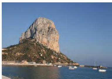
Peñón de Ifach

Saldremos del hotel, pasando por delante del Peñón de Ifach y las Salinas para dirigirnos hacia la N-332 dirección Alicante, a unos 4 km a la izquierda encontramos el Barranco del Mascarat ( Espacio singular de extremada belleza y paraje de gran valor estratégico, encontrándose unidos los dos acantilados por los puentes superpuestos del ferrocarril de vía estrecha y la carretera ). Después de 6 km nos desviaremos a la derecha por la CV-755 dirección Altea la Vella, la atravesaremos y seguiremos dirección Callosa d'En Sarria donde tomaremos la estrecha CV-715 , pasando por Bolulla y Tarbena. ( En el Coll de Rates se divisan unas espectaculares panorámicas ). Carretera motera. Parada 10 min.