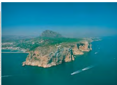
Cabo de San Antonio