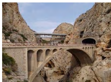
Barranco del Mascarat